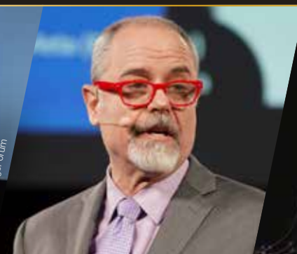
JAY SAMIT AI & FUTURE OF WORK