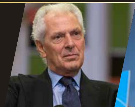
MARCO TRONCHETTI PROVERA CORPORATE SUSTAINABILITY