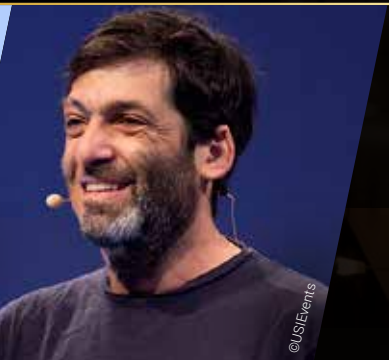
DAN ARIELY MOTIVATION