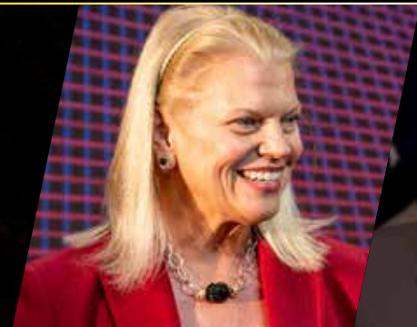
GINNI ROMETTY LEADERSHIP & PURPOSE