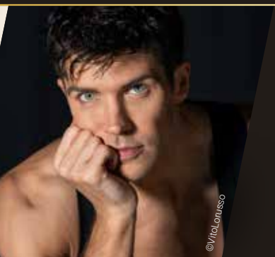
ROBERTO BOLLE MINDSET