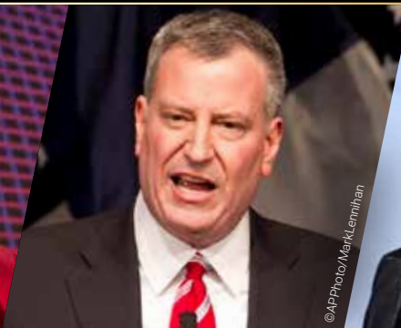
BILL DE BLASIO CRISIS MANAGEMENT