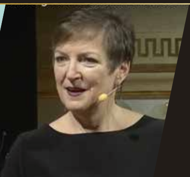
AVIVAH WITTENBERG-COX GENDER & GENERATIONAL BALANCE