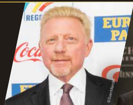
BORIS BECKER RESILIENCE